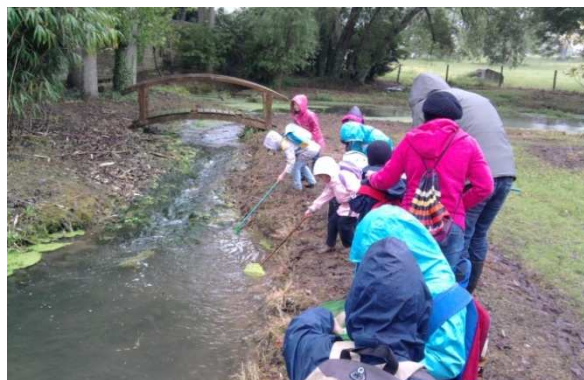
Les Grandes Sections et les CP ont pêché pendant le festival de l'eau et sont allés visiter l'aquarium de Trouville