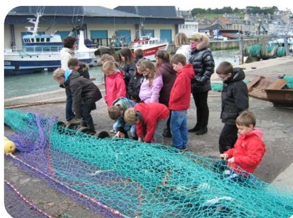
Les CE1, CE2, CM1 et CM2 sont allés découvrir Port-en-Bessin (la criée et le chantier naval) et l'estuaire de l'Orne à Sallenelles