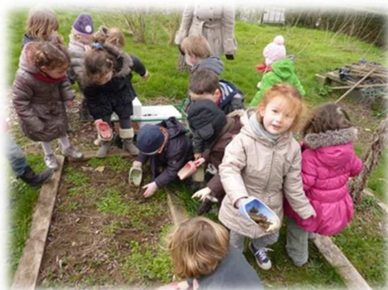
Les PS-MS ont également jardiné dans le jardin de l'école et sont allés voir un spectacle : Maître Renart à l'espace Tandem