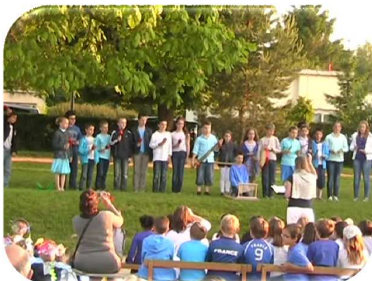
Le spectacle de fin d'année réunissait chant, danse et musique,... toujours sur le thème de l'eau.