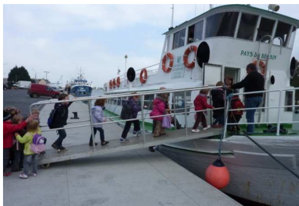
Les Petites et Moyennes Sections ont pris le bateau pour aller de Caen à Ouistreham

Toutes les classes ont travaillé pendant l'année scolaire 2012-2013 autour du thème de l'eau .