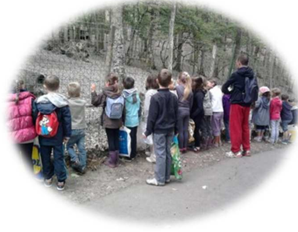
Les PS, MS, GS, CP et CE1 sont allés passer une matinée à la forêt de Grimbosq

Au mois de décembre, grâce au comité des fêtes d'Avenay, les PS-MS-GS ont vu le spectacle : le fil à l'espace Tandem ; les GS, CP, CE1 ont vu Loulou au cinéma tandis que les CE2-CM1-CM2 ont vu La Belle et la Bête de Cocteau.