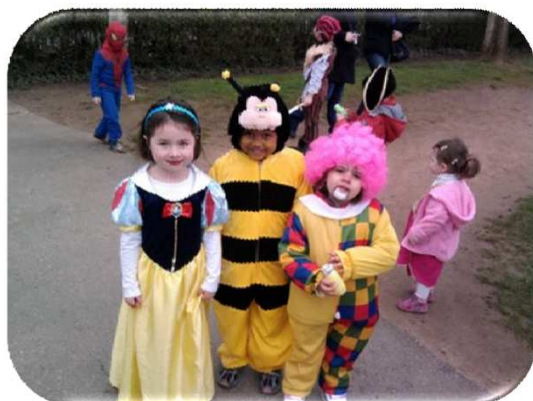
La matinée costumée