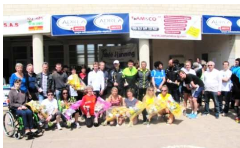
Les gagnants et les organisateurs