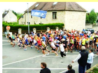
Les concurrents sur la ligne de départ