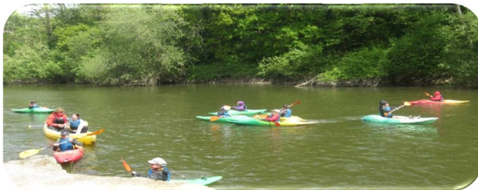
Les CM1-CM2 ont effectué 5 séances de kayak, sur l'Orne, au Val de Maizet